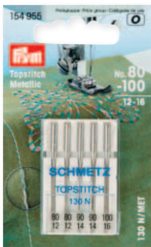
C 57 x 93 mm