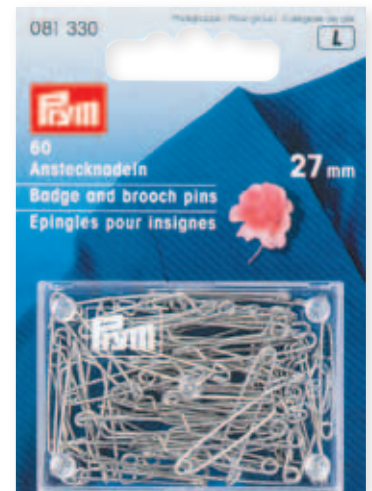
B 67 x 93 mm