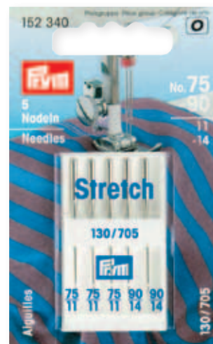
D 57 x 93 mm