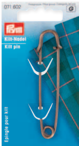
A 57 x 105 mm